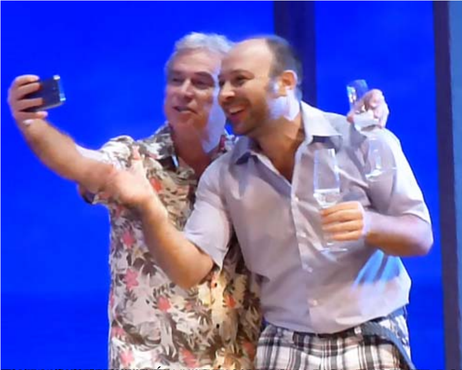
www.madridteatro.net/2014/10/15/cancun-jordi-galceran-g-olivares-entrevista-1/ (Pablo Albiol, Pablo),