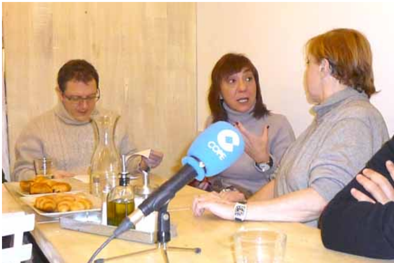
ÓSCAR DE LA FUENTE / ROCÍO CALVO / MARÍA LUISA MERLO