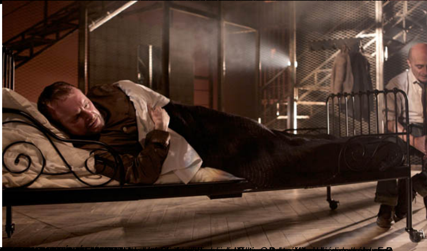
El momento del diagnóstico en 'El Rinoceronte' de Ionesco, en el estreno de la obra en el Teatro de la Abadía de San Agustín de Madrid el 14 de noviembre de 2011.