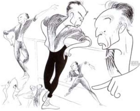
Dibujos de George Balanchine © Al Hirschfeld. BALANCHINE es un marca registrada por The George Balanchine Trust

Sábado, 04 de Octubre de 2014 14:36 - Actualizado Domingo, 05 de Octubre de 2014 06:11