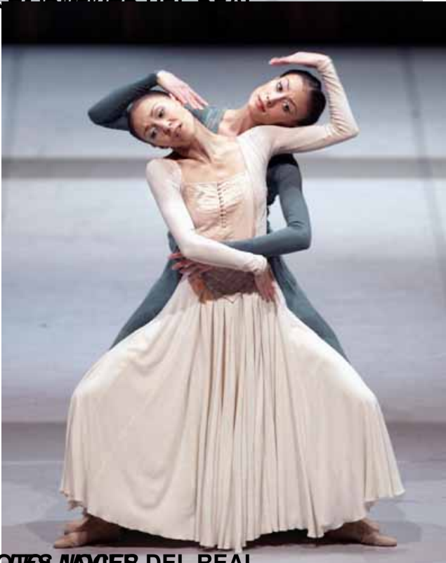
FOTOGRAFÍA DEL REAL