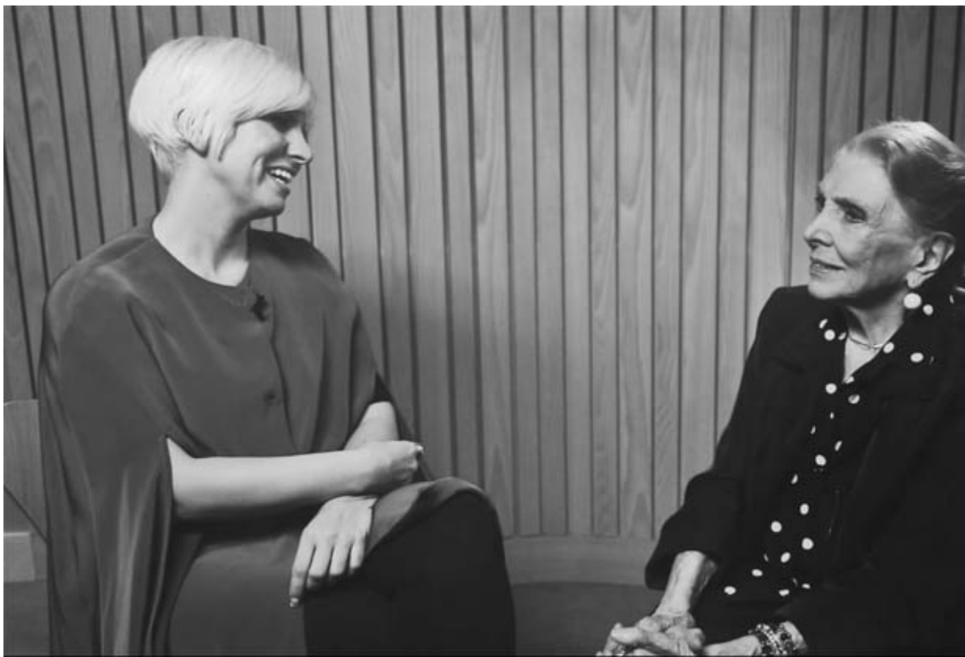
PASIÓN VEGA / MARÍA DOLORES PRADERA