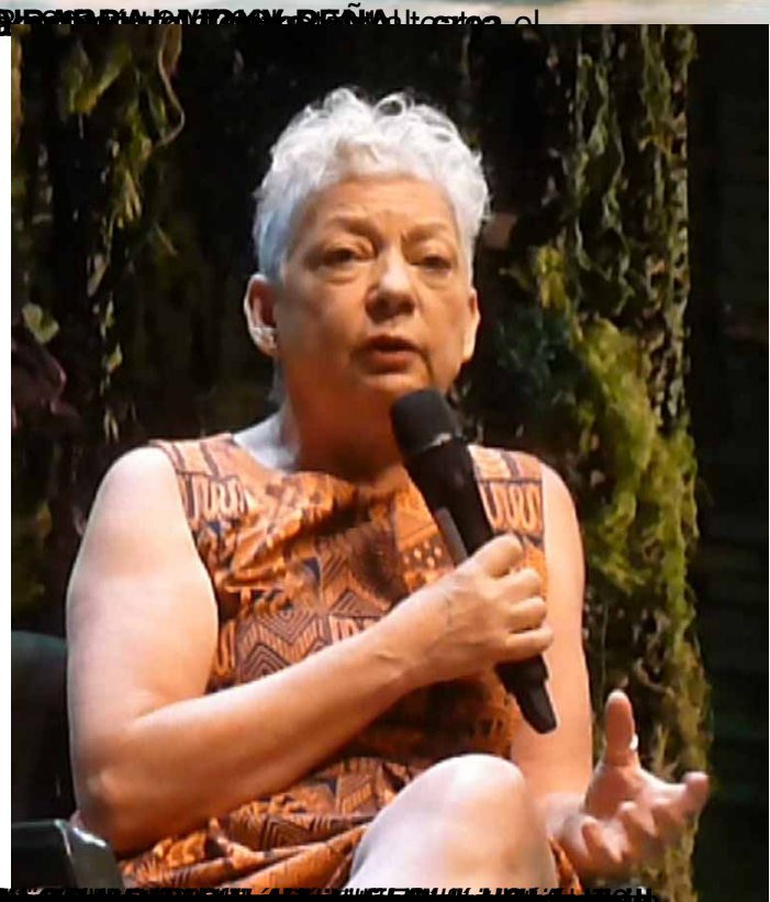
Actriz hablando durante la obra.