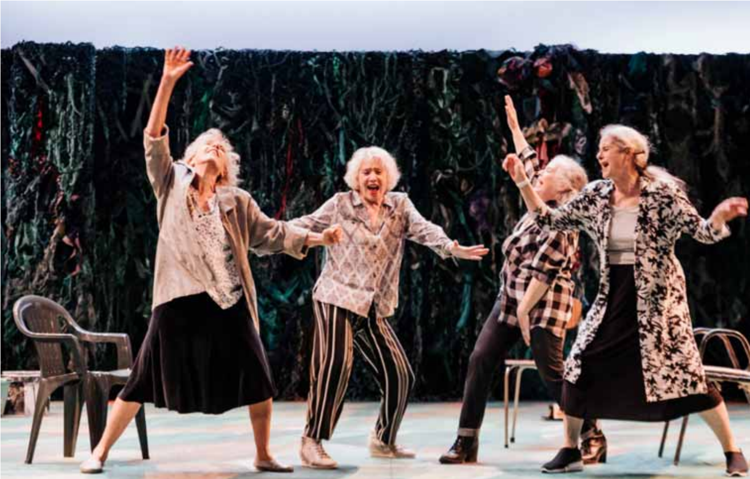
Actrices en escena durante la obra.