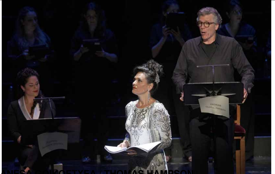
VANESA GOIKOETXEA / THOMAS HAMPSON