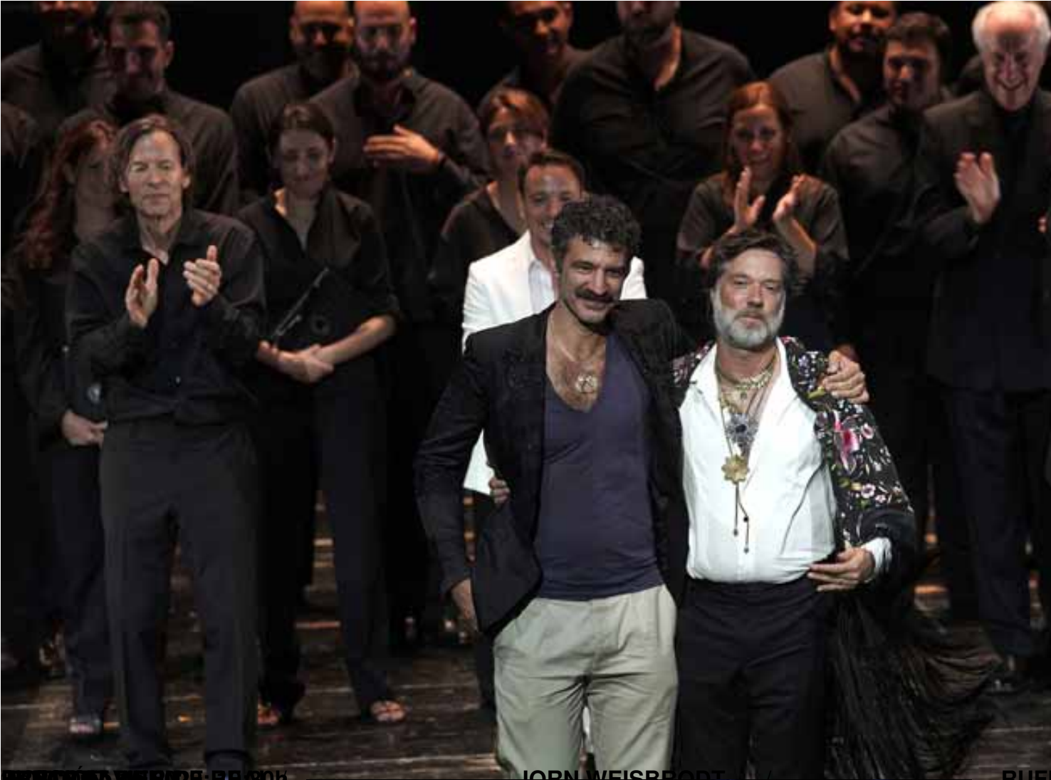
DISCIPULO / EL BUENO PERSON