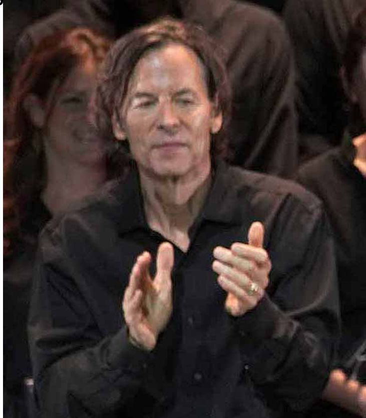
WAINWRIGHT, RUFUS WAINWRIGHT