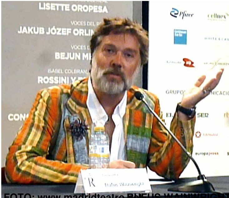
RUFUS WAINWRIGHT