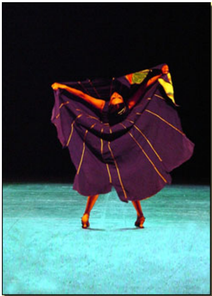
Teatro Albéniz 20:30 Horas

Un año más Teatro Albéniz , es marco para que durante cuatro días, contenga