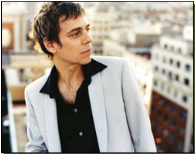
ARIEL ROT (ROCK)

Lunes, 12 de Abril de 2010 14:45 - Actualizado Lunes, 10 de Mayo de 2010 16:29