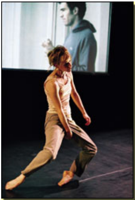
Autógrafa trabajo

Frequency B se estrenó el pasado 17 de marzo en la ciudad alemana de Dortmund.