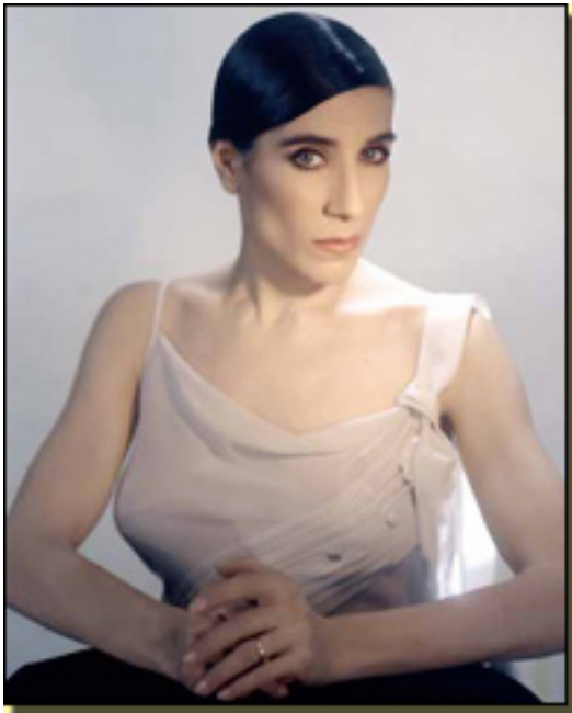
BLANCA LI