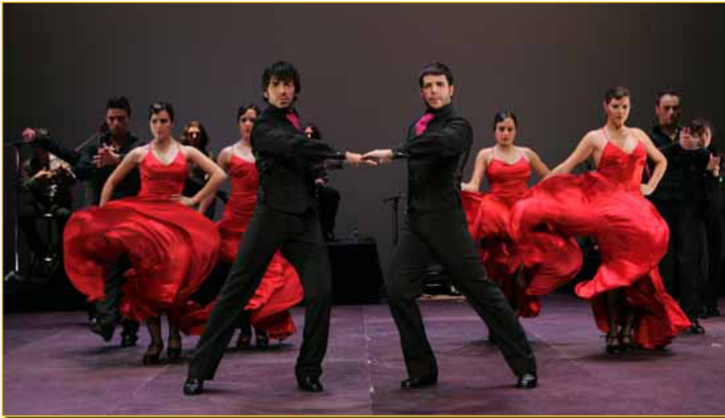
ROJAS & RODRÍGUEZ y la COMPañía