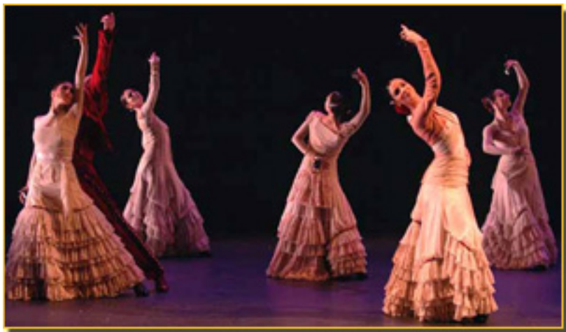
DUALIA FOTO: JOSEP AZNAR

Caprichos es la coreografía que Fernando Romero presenta.