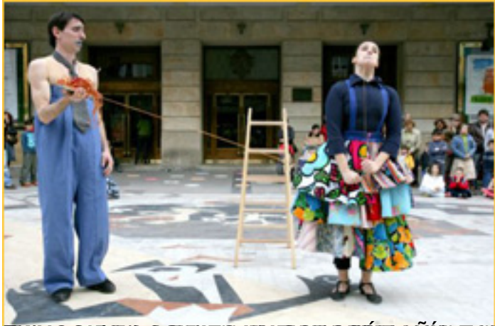
El público observa la danza en la villa. El gesto de la mano es un elemento clave de la coreografía.