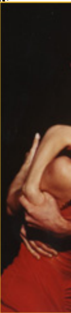
Detalle de un gesto de danza en la villa. El uso del color y el movimiento son fundamentales en esta tradición.