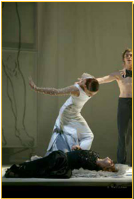
EL AMOR BRUJO

Domingo, 14 de Marzo de 2010 14:09 - Actualizado Martes, 11 de Mayo de 2010 16:30