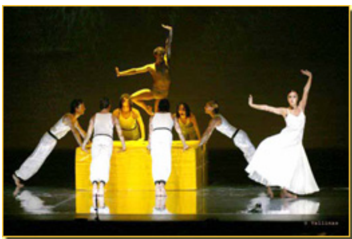
GYMNOPIEDIE Nº 1