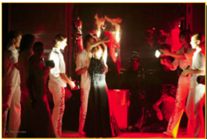
EL AMOR BRUJO

Domingo, 14 de Marzo de 2010 14:09 - Actualizado Martes, 11 de Mayo de 2010 16:30