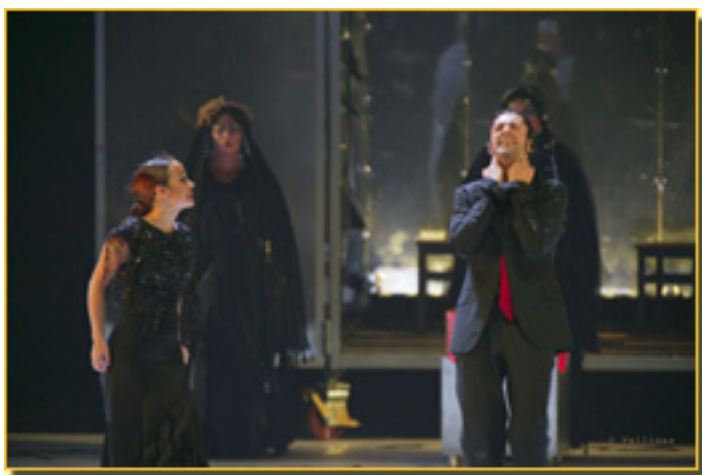
EL AMOR BRUJO