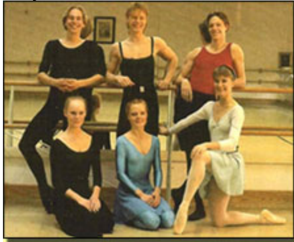
1989: Cuerpo de Baile de The Royal Swedish Ballet.

■ En el catálogo que Royal Swedish Ballet publicado en 1989, con Johan Inger una de sus paris