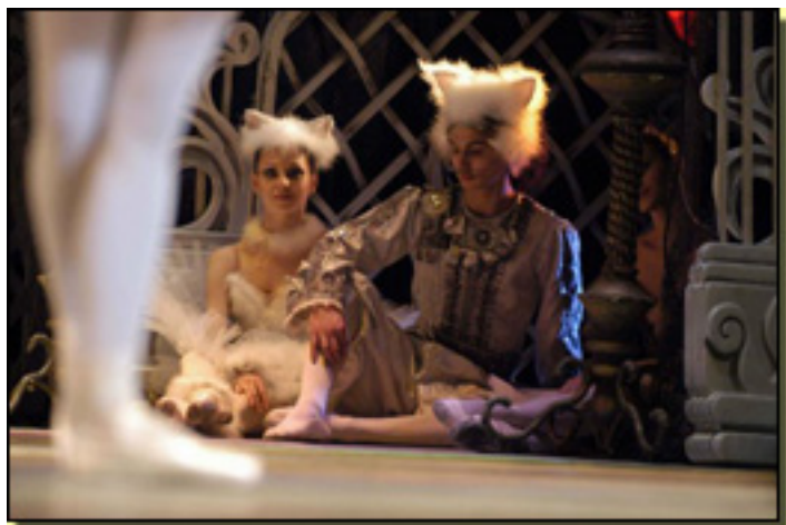
LA BELLA DURMIENTE

Lunes, 22 de Marzo de 2010 11:51 - Actualizado Martes, 11 de Mayo de 2010 15:36