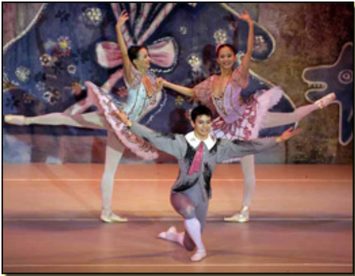
BALLET CLÁSICO DE MOSCÚ B.C.M.

Lunes, 22 de Marzo de 2010 11:51 - Actualizado Martes, 11 de Mayo de 2010 15:36