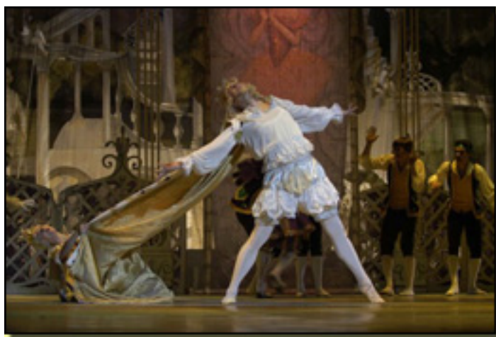
LA BELLA DURMIENTE

- En efecto, a pesar de su La Bruja La Bruja lo rechaza, por que de final es el que de final es el . Lo que es el Lo que es el de de