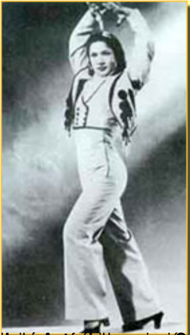
Un momento de la obra "El Menárgalo" de la compañía de danza española, en su...

Sábado, 20 de Marzo de 2010 09:31 - Actualizado Jueves, 13 de Mayo de 2010 07:06