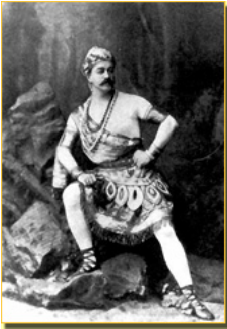
LA BAYADERA , (SEVORANOV

Sábado, 20 de Marzo de 2010 15:29 - Actualizado Jueves, 13 de Mayo de 2010 06:49