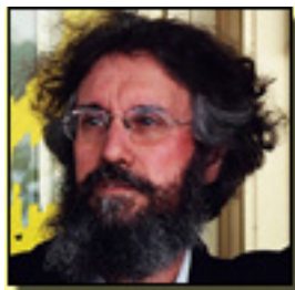
José Ramón Díaz Sande copyright©diazsande

El público – no día de estreno y con gran afluencia – aplaudió con gran entusiasmo. ■