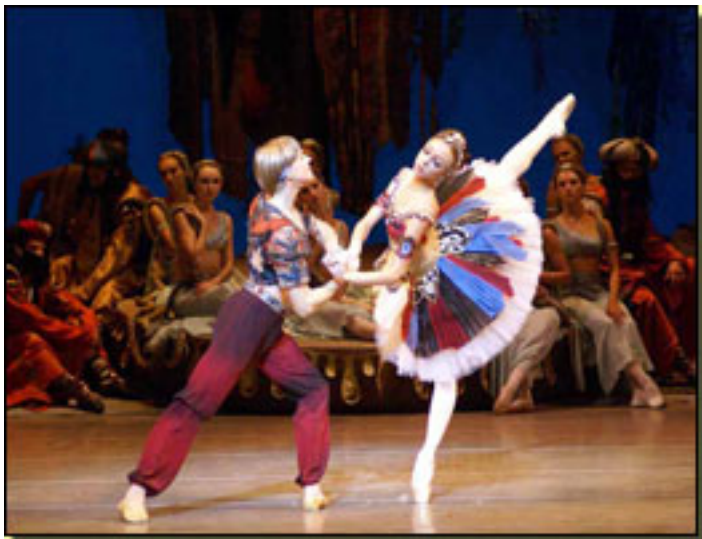
El Real desea mostrar Marinsky está en

De todo su rico repertorio se ha elegido Le Corsaire (El Corsario) , obra que – salvo algunos privilegiados o especialistas – solamente se conocía, en España, a través del socorrido paso a dos, reiterativo en cualquier Gala de Danza que se precie. Con respecto a España se añade un aliciente: nunca se ha estrenado y el gran público no la conoce en su integridad. Tal afirmación, salida de las declaraciones de