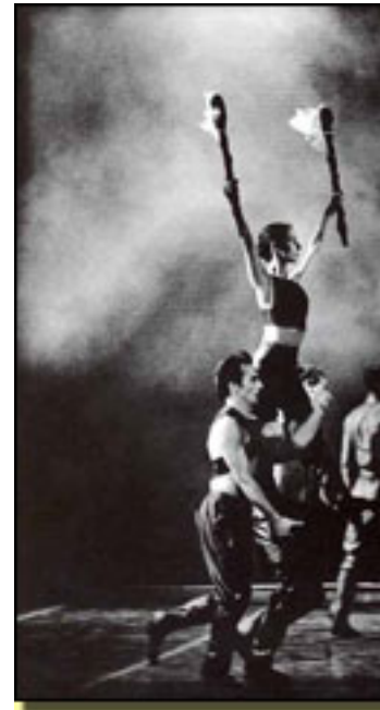
Siete temas - el

localismo colorista de cada una de ellas en tópicos «ninóticos». Un fresco blanquinegro traza los lugares comunes - luminosidad, ludopatía, sensualidad y alegría de vivir- que caracterizan la zona y que responden a lo que se ha dado en llamar «espíritu mediterráneo». Los griegos le adjudicaron un dios: Dionisio.