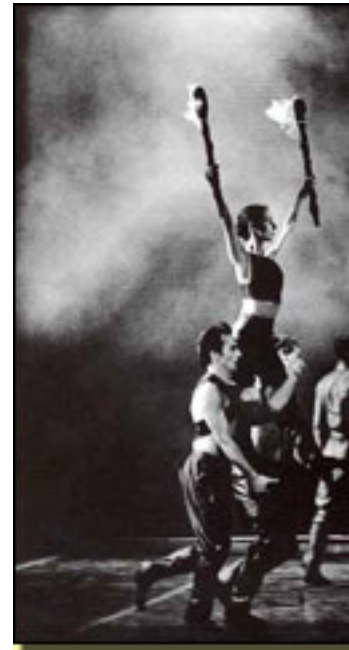
Siete temas - el

localismo colorista de cada una de ellas en tópicos «ninóticos». Un fresco blanquinegro traza los lugares comunes - luminosidad, ludopatía, sensualidad y alegría de vivir- que caracterizan la zona y que responden a lo que se ha dado en llamar «espíritu mediterráneo». Los griegos le adjudicaron un dios: Dionisio.