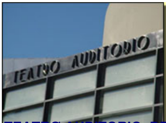
TEATRO AUDITORIO, DE ROQUETAS DE MAR.