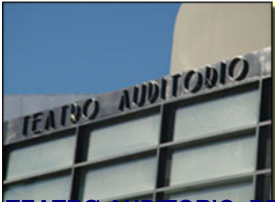
TEATRO AUDITORIO, DE ROQUETAS DE MAR.