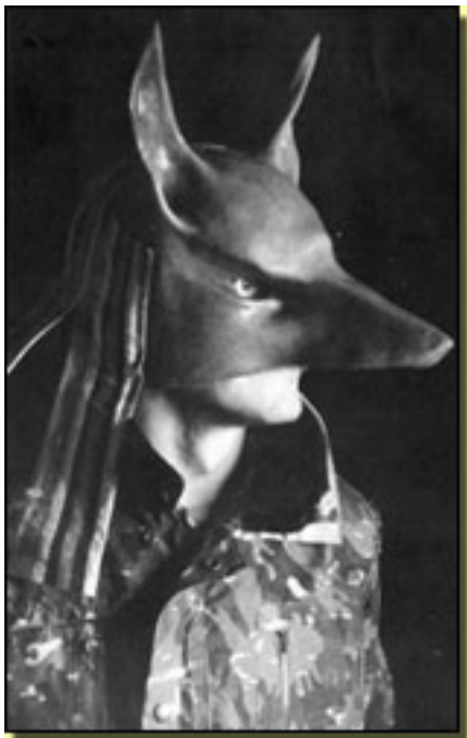
Sol y sombra (1987)

La “camada” de Ernesto Caballero, hijos más cercanos a la incipiente democracia, convivían con temas más a ras de suelo y sus personajes dejaban de ser estilizaciones de los que pululaban por las calles. El y sus compañeros consiguieron estrenar, pero tuvieron que pagar un canon : ser olvidados por el teatro oficial o institucional y llevar sus bártulos a “garitos” -hoy “Salas Alternativas” - dispuestos a recibir una serie de textos que fuesen más allá de aquellas primeras ventanas abiertas.