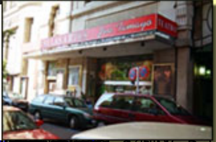
http://www.elpais.com/ a las 21 h30 a 13.30 h.