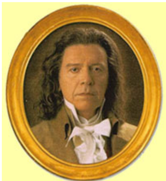
Tayllerand (J.M. Flotats)