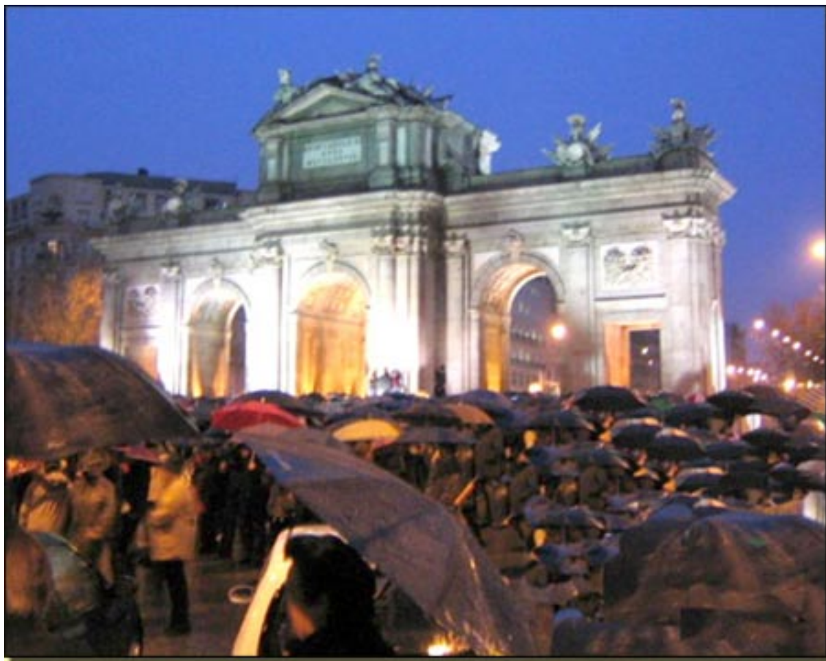
MANIFESTACION ANTE EL 11 DE MARZO, MADRID