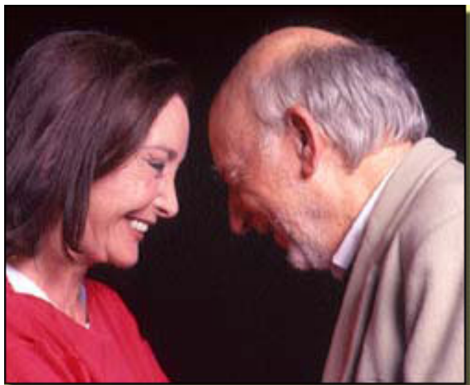
NURIA ESPERT/ ADOLFO MARSILLACH

Domingo, 14 de Octubre de 2012 10:07 - Actualizado Domingo, 14 de Octubre de 2012 10:58