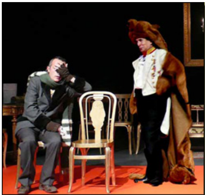
CHEMA RUIZ/FRANCISCO VIDAL