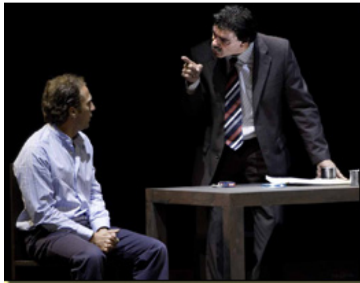
JOSÉ VICENTE MORÓN/J.MAGARIÑO