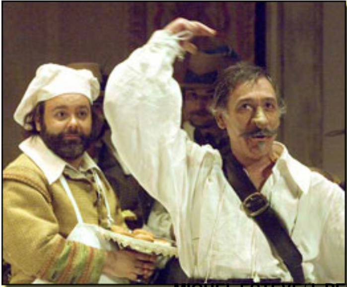
MIGUEL ESTEVE/J. PEDRO CARRIÓN

Viernes, 19 de Marzo de 2010 17:46 - Actualizado Sábado, 24 de Abril de 2010 14:57