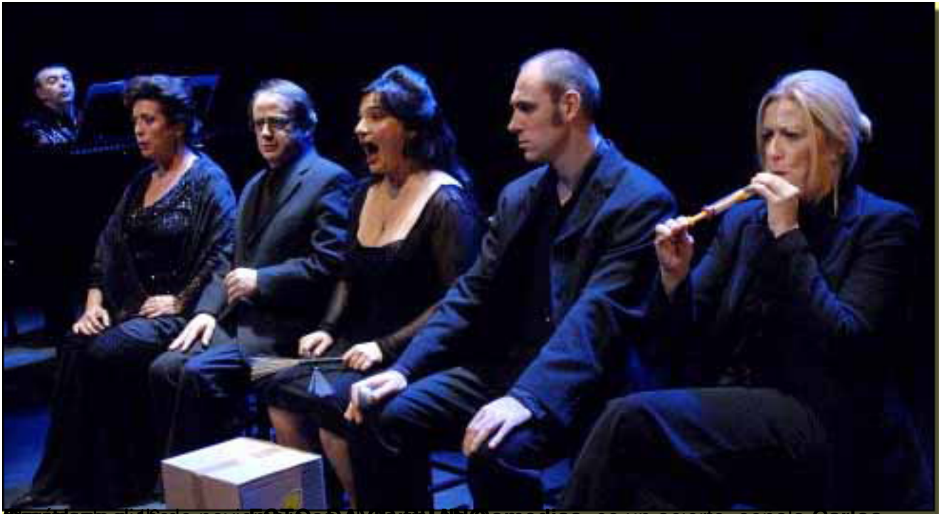
En el teatro el día de noviembre. Las Comedias es un acierto, señala Carlos

Viernes, 19 de Marzo de 2010 19:14 - Actualizado Viernes, 07 de Mayo de 2010 18:33