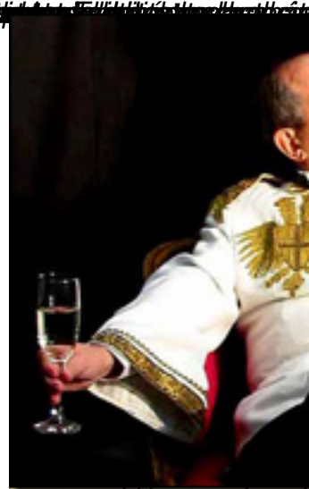
El actor más sorprendente es el actor con sus compañeros

(* Caballero de San Juan, de Calatrava y del Toisón de Oro, estuvo