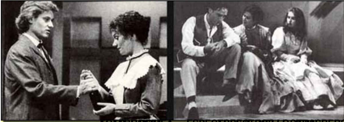
ESPECTÁCULO (LOS SIERRAS BERG, 1994)

Escrito por José R. Díaz Sande. Jueves, 18 de Marzo de 2010 08:37 -