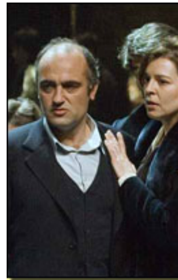
F. ORELLA/O.MOLINA/E. GELABERTH