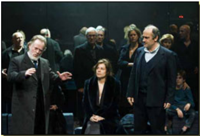
CHEMA DE MIGUEL/E. GELABERTH