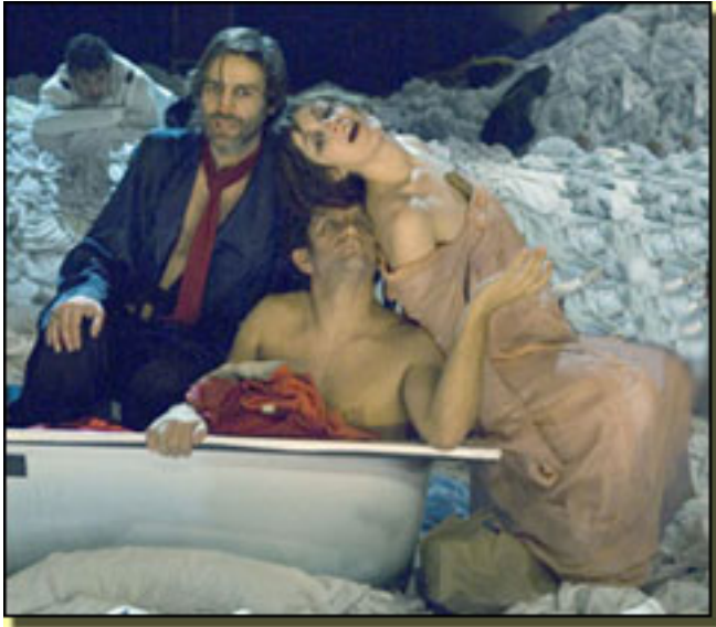
ALBERTO SAN JUAN PEDRO CASABLANC NATHALIE POZA

Viernes, 19 de Marzo de 2010 06:57 - Actualizado Sábado, 27 de Junio de 2020 16:40