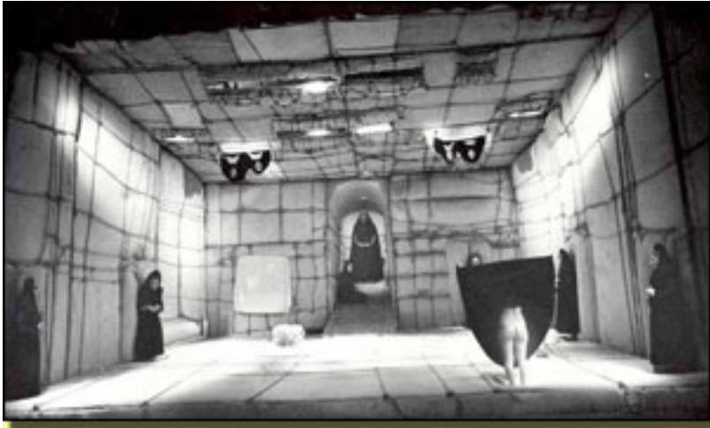
VERSIÓN DE ÁNGEL FACIO (1976)