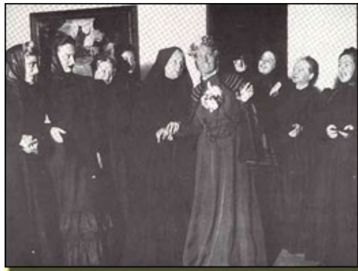
MARGARITA XIRGU Y LA COMPAÑÍA LA CASA DE BERNARDA ALBA (1945)

En realidad la obra se iba a estrenar en octubre de 1936 en América con el título de Xirgu . Asesin