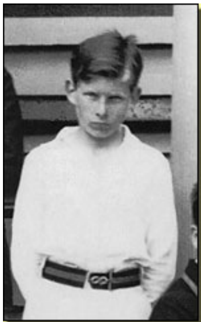
SAMUEL BECKETT (12 AÑOS, 1918)