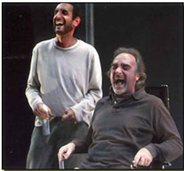
J.L. ESTEBAN/R. JOVEN

- En Final de partida el tenebrismo es brutal – aclara