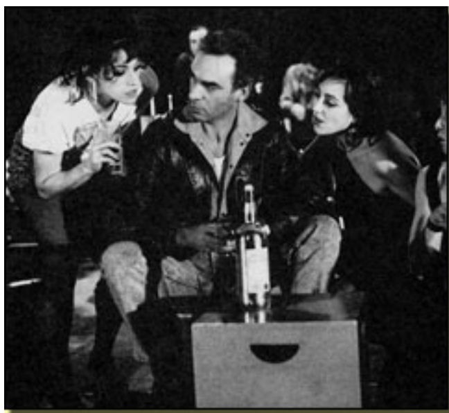
LA CIUDAD, NOCHES Y PÁJAROS (Sala Olimpia ,1990)

A partir de 1994 escribe y produce para el Teatro del Temple Rey Sancho y en 1995/96, también para él, escribe