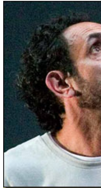
JOSE L. ESTEBAN

- Final de Partida es muy atractiva para el Beckett, pero cuando sube el teatro claro siempre se