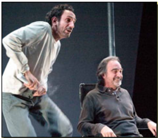
J.L. ESTEBAN/R.JOVEN

Viernes, 19 de Marzo de 2010 07:55 - Actualizado Jueves, 29 de Abril de 2010 19:28