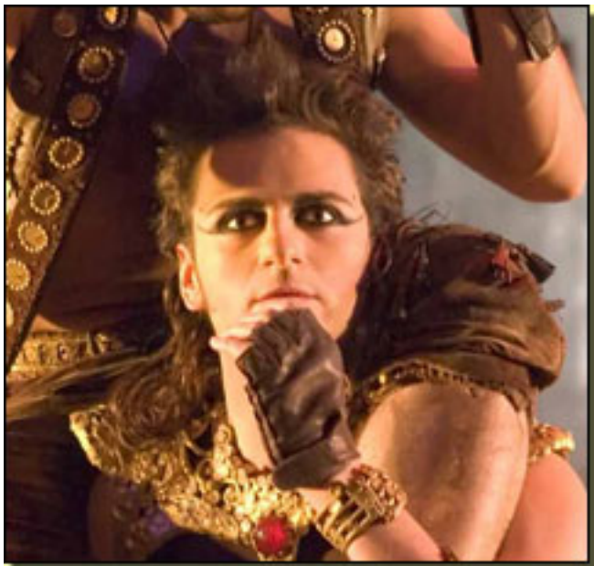
ASIER ETXEANDIA

Viernes, 19 de Marzo de 2010 10:11 - Actualizado Sábado, 04 de Febrero de 2017 09:41