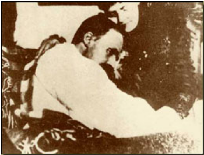
NIETZSCHE Y SU HERMANA