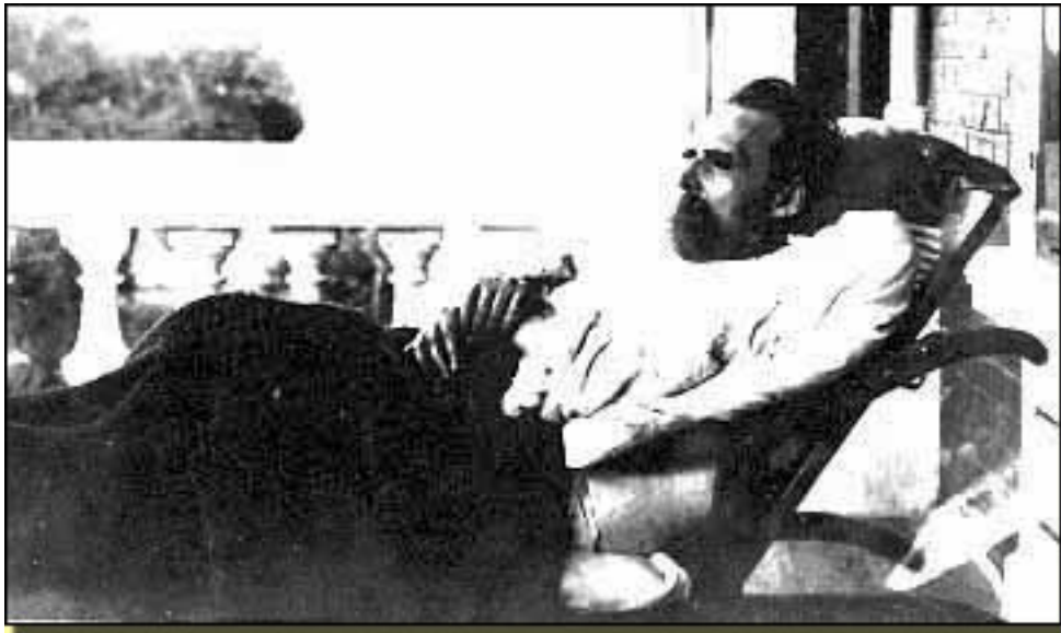
NIETZSCHE (ÚLTIMOS DÍAS)