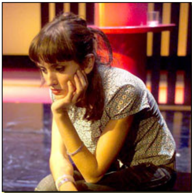
MARINA SAN JOSÉ

- He leído mucho y ya he leído los personajes de esta Biblia como la arena ha empezado a ser el teatro