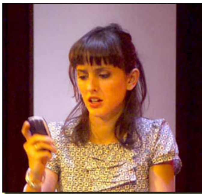
MARINA SAN JOSÉ

es actriz joven nacida te William Layton el laboratorio de interpretación ha u El beso