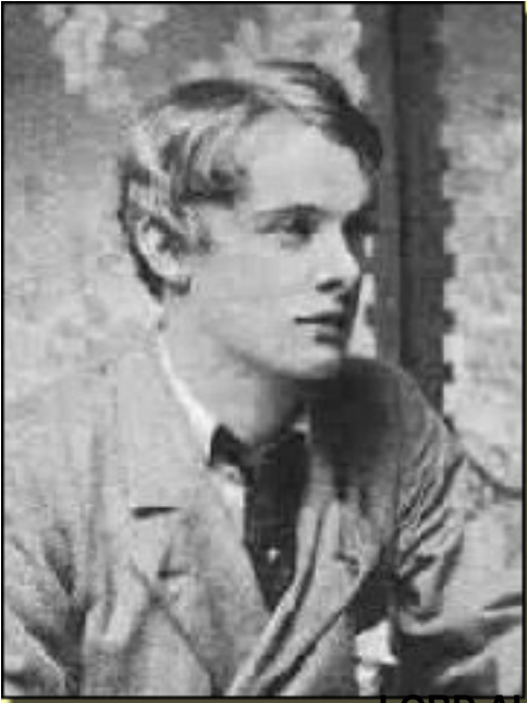
LORD ALFRED DOUGLAS

Viernes, 19 de Marzo de 2010 12:04 - Actualizado Viernes, 19 de Marzo de 2010 12:34