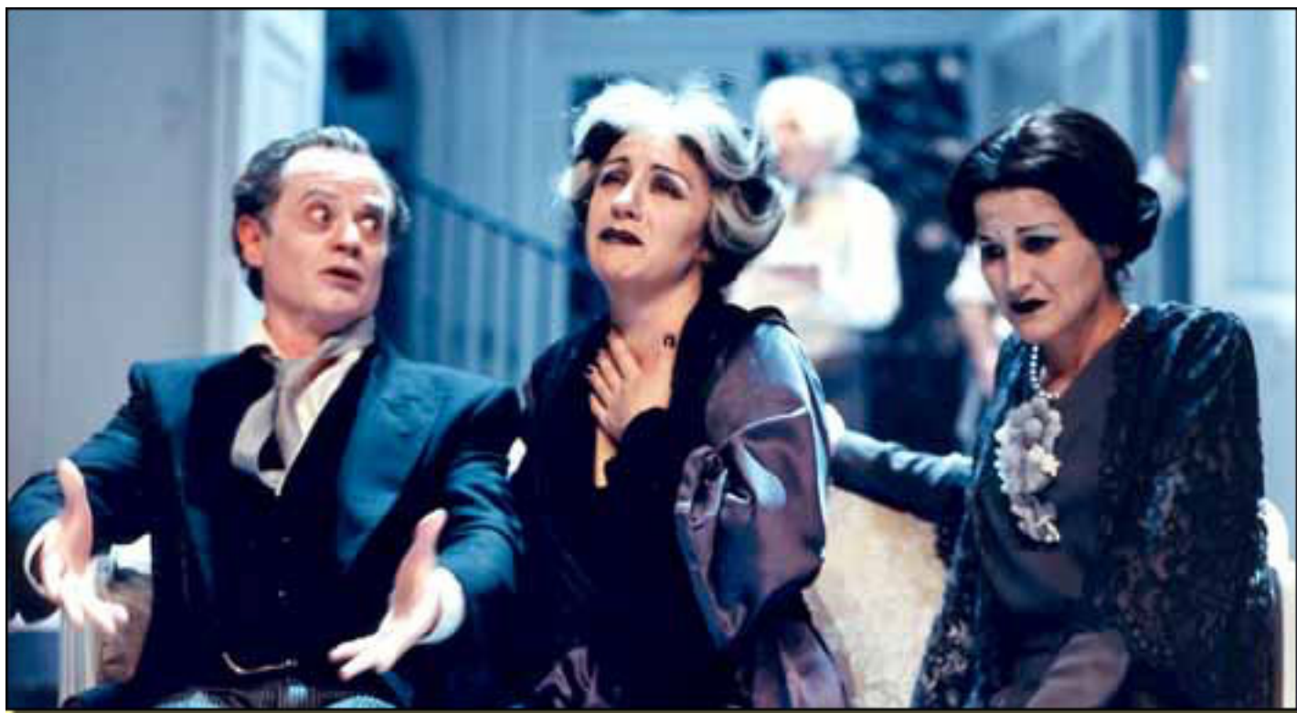
MADRE (el drama padre) TEMPORADA CDN 2000/2001