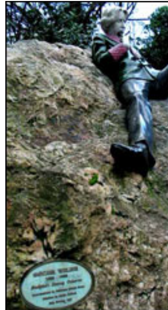
La segunda noche: OSCAR WILDE MONUMENTO EN DUBLIN. Inspector General de Scotland Yard, Sco