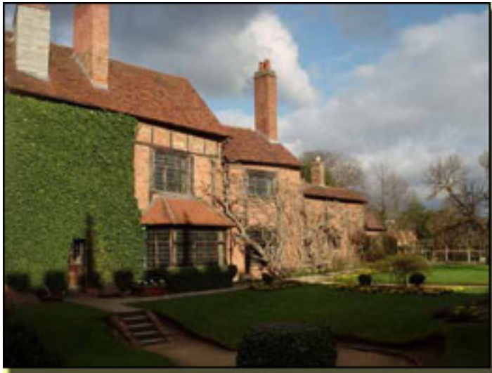
Stratford-unpo-Avon British Council