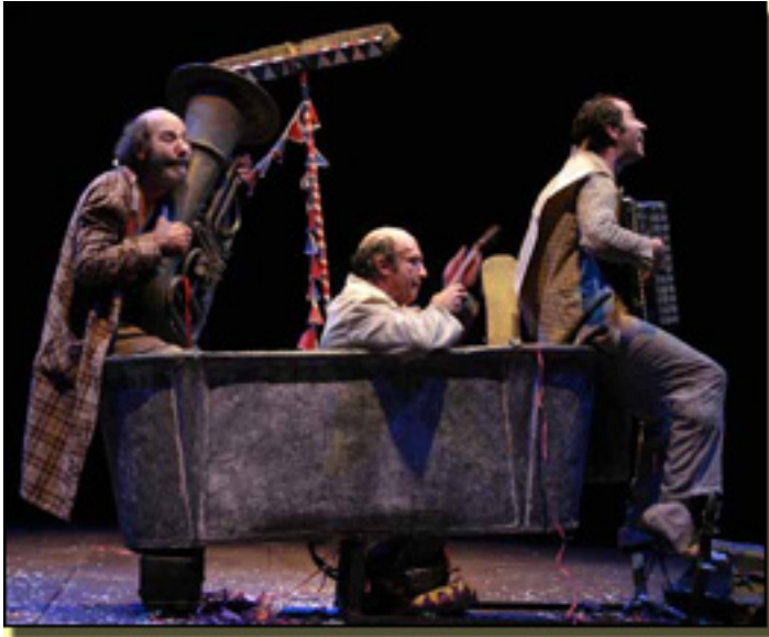
Aunque lo que definitivamente Crítica 2 separa a las c

Sábado, 27 de Marzo de 2010 20:18 - Actualizado Jueves, 29 de Abril de 2010 11:53