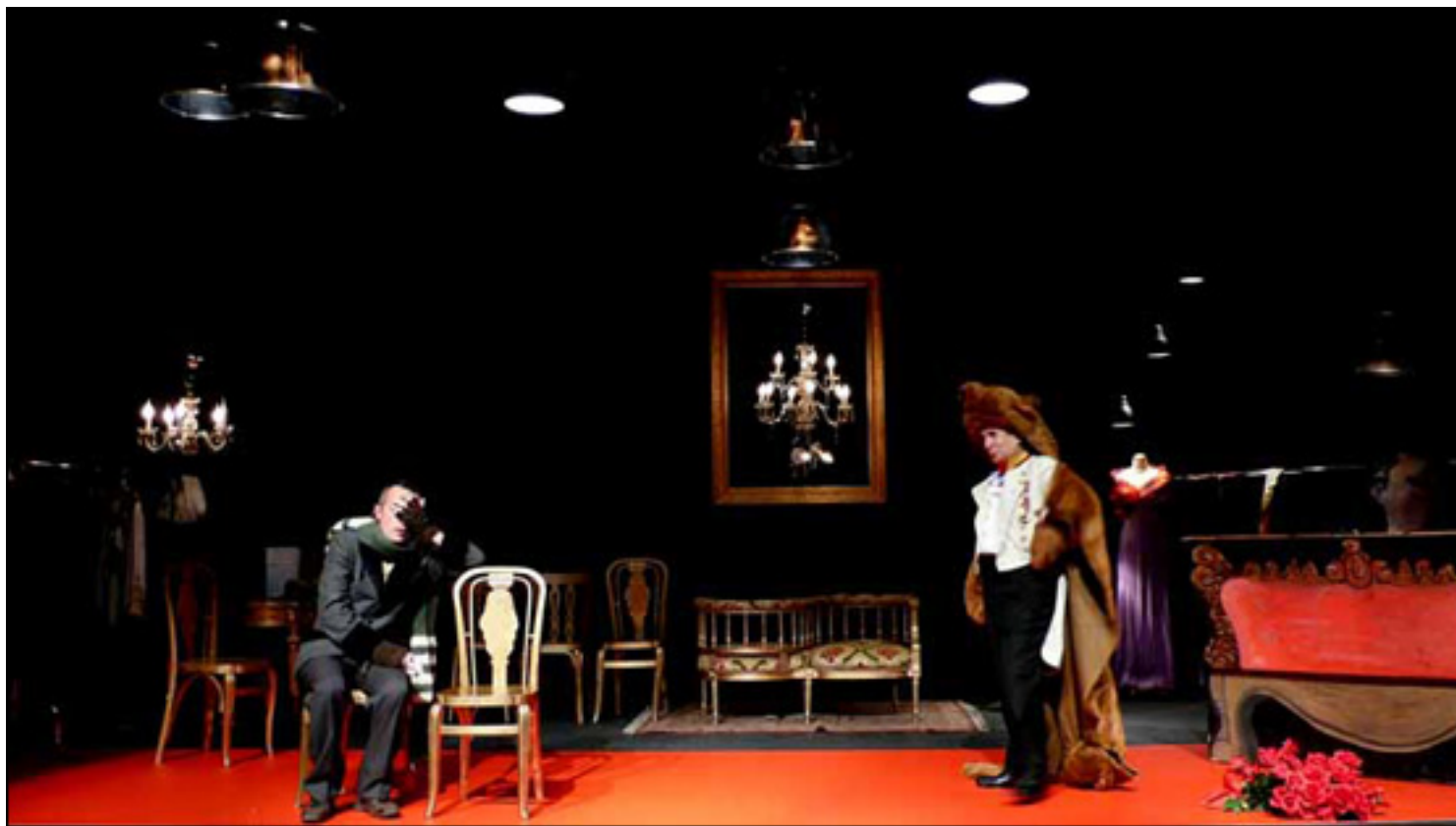
CHEMA RUIZ/ FRANCISCO VIDAL