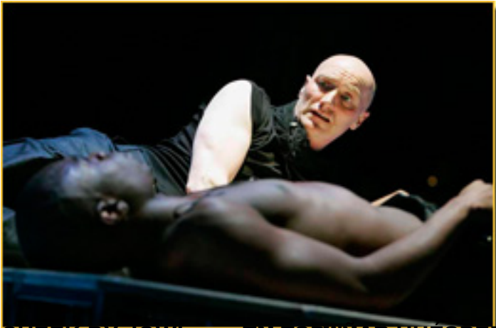
CHEEK BY JOWL, EN EL AMNAR HUESPED

Domingo, 14 de Marzo de 2010 12:31 - Actualizado Sábado, 15 de Mayo de 2010 10:13