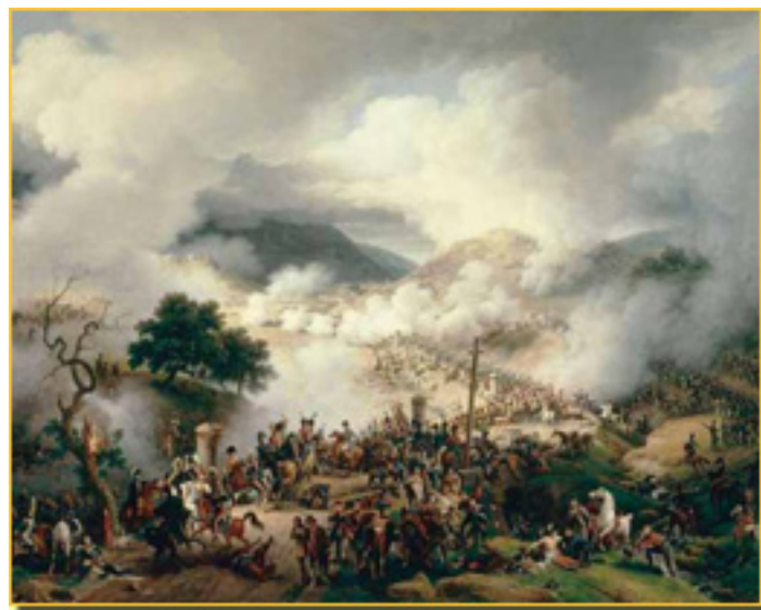
BATALLA DE SOMOSIERRA, 1810 LOUIS FRANÇOIS LEJEUNE

Este proyecto es realizado por el Ayuntamiento de Madrid, en colaboración con el Ministerio de Cultura y el Ayuntamiento de Madrid.