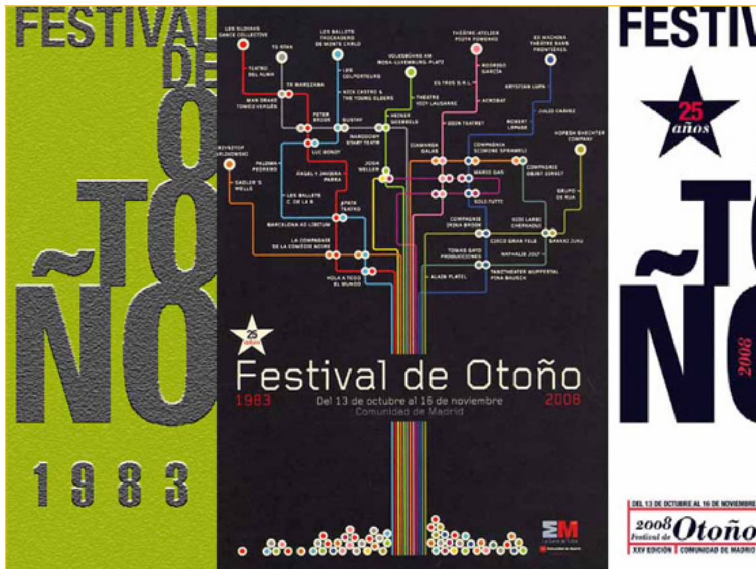
EN EL 25 ANIVERSARIO (1983 – 2008)

El Festival de Otoño de Madrid cumple 25 años. Santiago Fisas – Cons