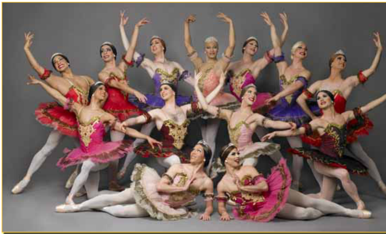
LES BALLETS TROCKADERO DE MONTE CARLO

. Mi único mérito ha sido no intervenir, aguantar las presiones y dejarle hacer.