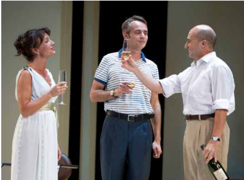
SUSANA HERNÁNDEZ / CARLES MOREU / PEPE VIYUELA

Pepe Viyuela es de sobras conocido por el gran público de televisión, debido a su intervención en la serie televisiva Aída . Tiene un amplio "currículum" como intérprete teatral desde 1988, así como de cine. Es, también, autor de una serie de libros.